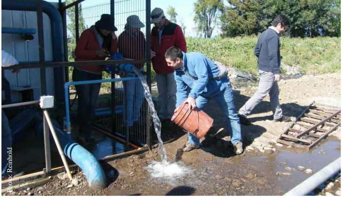
قياس تدفق المياه